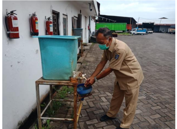
PERGUDANGAN JL. DEMAK TIMUR 28