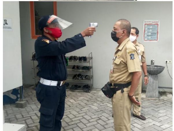
CENTRA PROTEIN PRIMAN JL. DUPAK RUKUN NO 81