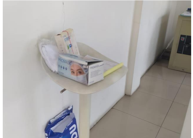
PT 2 BERSAMA EKSEL MEBELINDO JL. TANJUNGSARI 44 A 12